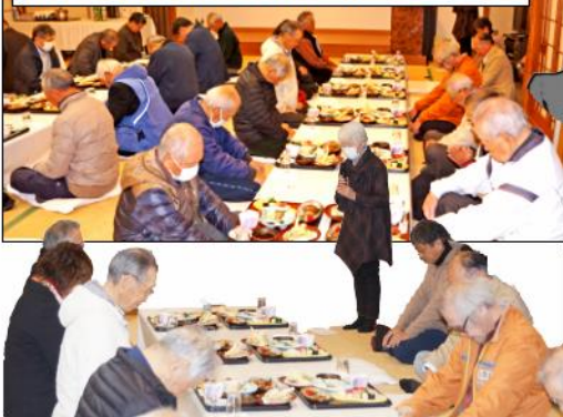
昨年亡くなられた15名の方々への黙祷