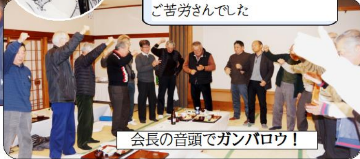
会長の音頭でガンパロウ！