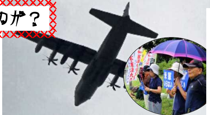
一回だけ飛来してきたKC130

鹿屋でやる必要があるのか。戦争準備の訓練はまっぴらだが、どうしても必要というのなら、人家のない海上か、自分の本国でやったらいい。わざわざ鹿屋まで来なくていい。