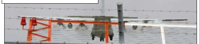
突如現れた対潜哨戒機P3C

イベント広場付近の道路で、1時間程度、スタンディングアピールで脱原発や改憲反対など市民に訴えます。時間のある方、是非ご参加を!